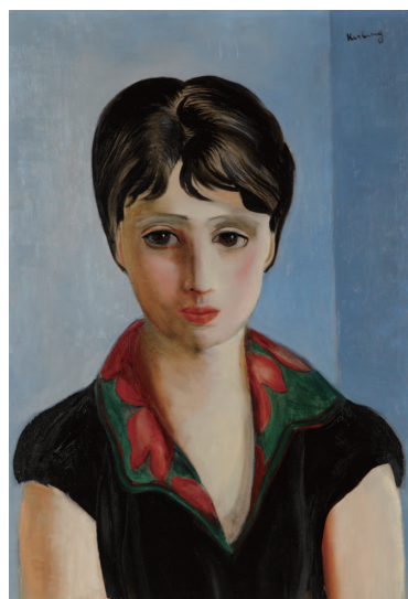
キスリング「少女」当館蔵 (後期展示)