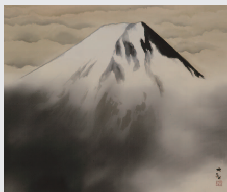
横山 大観「巒雲表」 当館蔵 (前期展示)