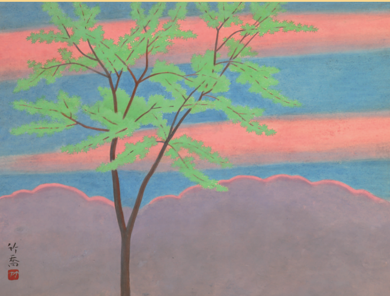
小野竹喬 「朝」 当館蔵 (前期展示)