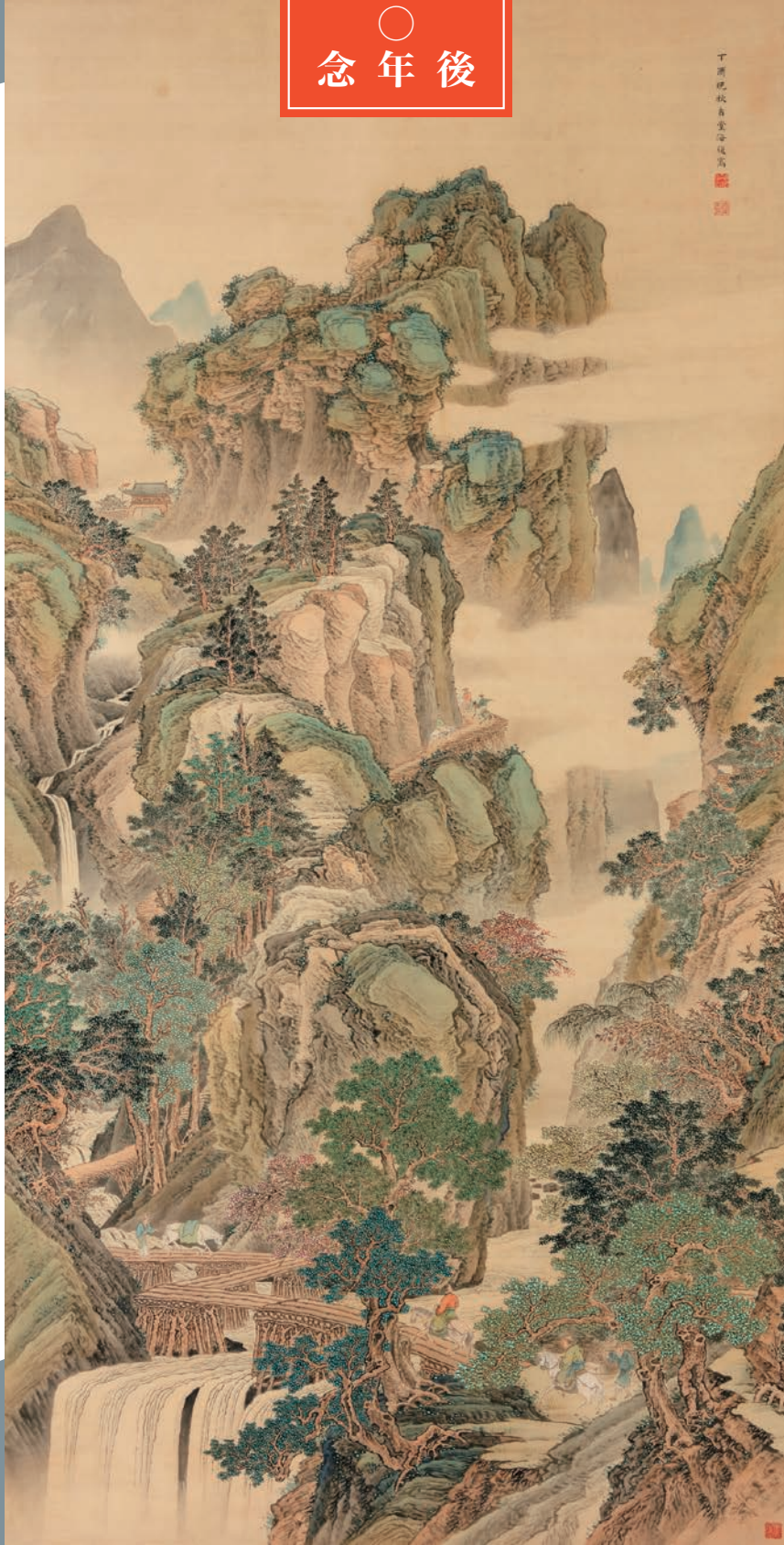
内海吉堂筆《栈道高秋図》 明治30年(1897) 福井県立美術館蔵 [前期展示]